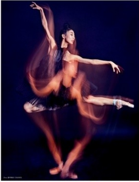
Violet Book Japan