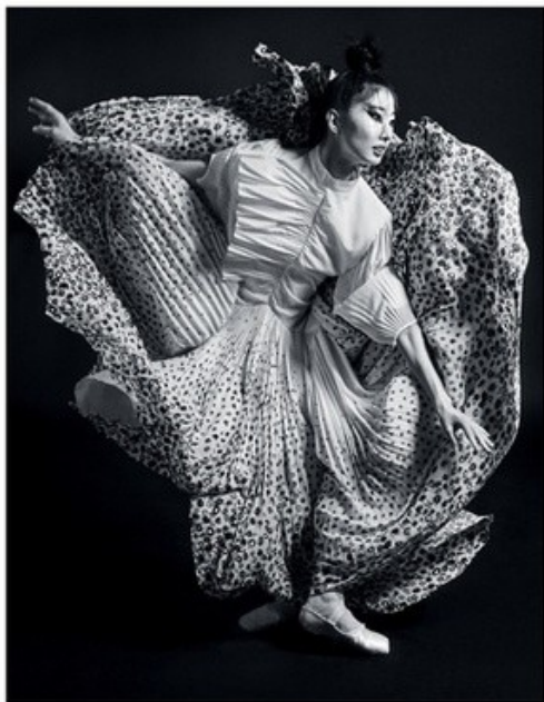
Violet Book Japan