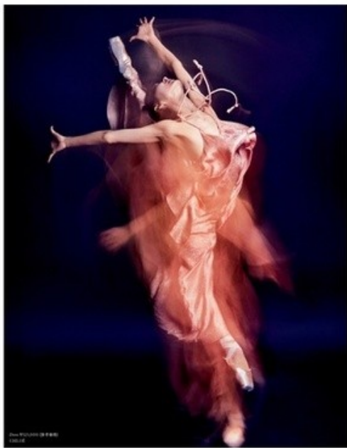
Violet Book Japan