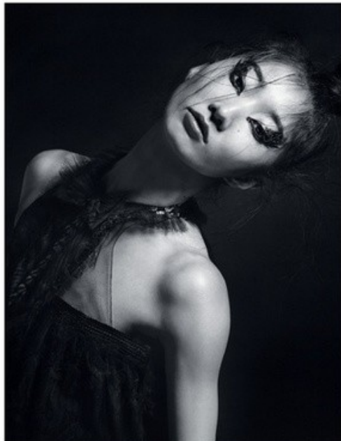
Violet Book Japan